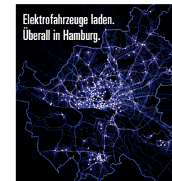
Elektrofahrzeuge laden. Überall in Hamburg.

In Hamburg steht Ihnen eine gut ausgebaute, öffentliche Ladeinfrastruktur zur Verfügung, die weiter wächst. Bis Mitte 2016 werden im Hamburger Stadtgebiet 592 Lademöglichkeiten, darunter 70 Standorte mit leistungsstarkem Schnell-Laden (ca. 30-45 Minuten), aufgebaut sein.